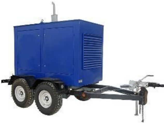
Дизель генератор в погодозащитном капоте на шасси