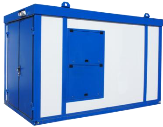
Дизельная электростанция в блок контейнере «Север»

Дизель-генераторные установки в зависимости от условий эксплуатации могут быть выполнены в следующих исполнениях: