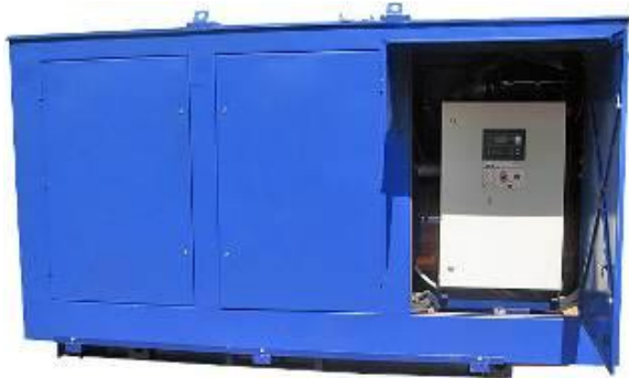
Дизель-генератор в погодозащитном капоте