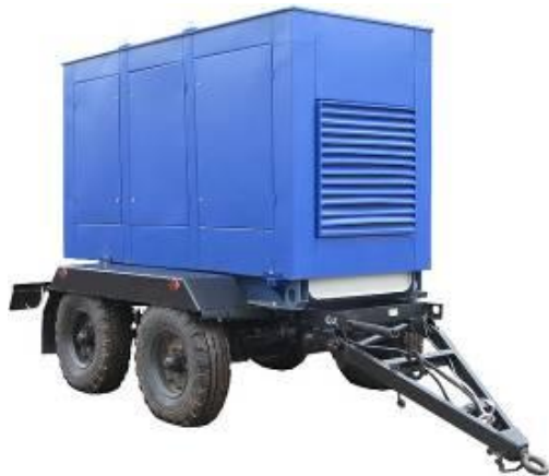
Дизель генератор в погодозащитном капоте на шасси